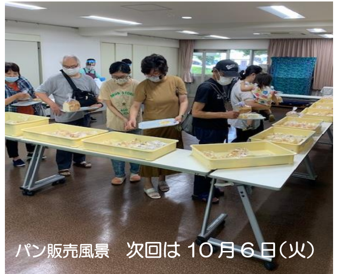
パン販売風景 次回は10月6日(火)