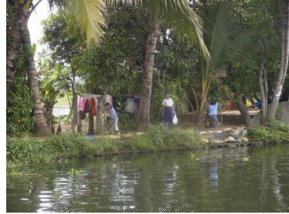
低い堤防の向こうが農地

途中で一軒の農家に寄った。水路脇の干拓堤防上の建物だ。船頭の知り合いらしい。トイレを借りてびっくりした。インド式トイレだが、床にはタイルが一部敷いてあり、水で清められ、清潔そのものだ。なぜか理由がわかった。清める水が水槽に豊富にあるのだ。でも、自動水洗ではなく、カラフルなプラスチックのヒシヤクで汲み、便器を流す手動水洗だ。排水先の農地または水域は広大だからか、汚染しているようには見えない。