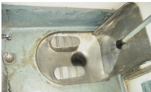
左が前、手洗い水栓がある

マドゥライはインドに 38 ある州の一つ、タミル・ナドゥ（TN）州の主要都市だ。TN 州はインドの最南部の東側を占め、インド全体からすると小さいようだが、州を縦断して分かったのだが、最北部に近いチェンナイ（旧名マドラス）から夜行列車で一晩かけ州の真ん中のマドゥライに着き、そこから車で半日かけてやっと州の南端コモリン岬（インド最南端でもある）に到達するほど広い。