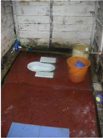
手前のタイル敷きで水浴び？

日本も水が豊富なので、清潔な水洗トイレになって、さらには(温)水でおしりを洗うまでになった。それはインドからの逆輸入かと思ったりした。