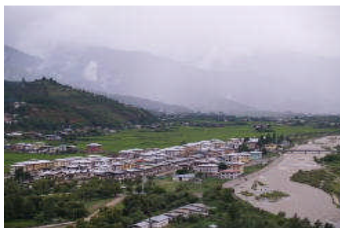
ブータン第二の都市・パロの中心街

九州ほどの面積の国土に人口はわずか70万人。インドの過密と反対に極端な過疎国土だ。インドとの国境から首都ティンブーまでの一本しかない国道を二百数十キロ、7～8時間かけてマイクロバスで延々と登るのだが、途中でレストランらしきものは一軒だけしかない。そこでの昼食時のトイレは大丈夫だが、午前午後でのトイレ休憩するトイレがない。トイレがないのはトイレを設置する建物そのものがない、というのが正確だ。ブータン人ガイドに聞くと、住民は誰もいないので道路脇の野原で大自然に向かって、と当然のような顔で指示された。立ち小便、というやつだ。女性も同様なのだが、このような秘境では仕方がない、と理解しているようだ。No-Toiletであることはインドと同じだが、尿意の意味の「自然が呼んでいる(Nature calls me)」と考えると悲惨さはない。